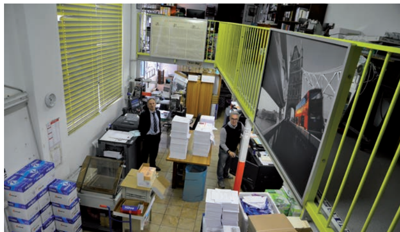
Gli spazi che ospitano 'e b.o.d.', piccolo ma ben organizzato "laboratorio artigianale familiare" specializzato nella produzione di micro tirature

UN "LABORATORIO ARTIGIANALE FAMILIARE", COSÌ SI DESCRIVE 'E B.O.D.', UNA PICCOLA REALTÀ PRODUTTIVA MILANESE IMPEGNATA A FORNIRE AGLI EDITORI UN SUPPORTO PRECISO E DI QUALITÀ PER LA PRODUZIONE DI LIBRI IN MICRO TIRATURE.