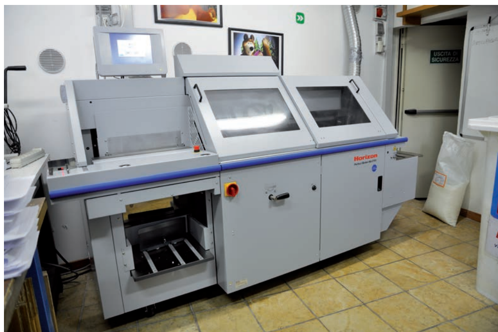
La brossatrice automatica monogranule Horizon BQ-270V installata presso 'e b.o.d.'