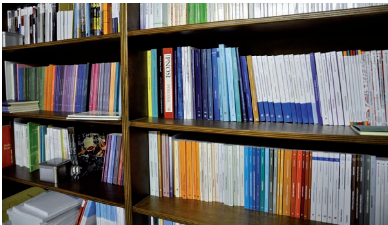
Una panoramica delle edizioni realizzate da 'e b.o.d.'

questo motivo ha deciso di dotarsi della migliore tecnologia Horizon presente sul mercato, capace di realizzare brossure di elevata qualità. La scelta ha premiato la brossuratrice automatica monoganasca Horizon BQ 270V, distribuita in Italia da Forgraf, una macchina che ha permesso di ottimizzare il processo di finitura. Dalle dimensioni ridotte, caratteristica molto apprezzata da e b.o.d., la brossuratrice hot melt di Horizon si distingue per la semplicità e la precisione di settaggio, peculiarità gra-